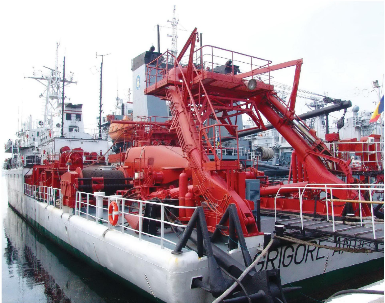
2006 – Nava Grigore Antipa acostată în Dana 0 a portului Militar Constanța