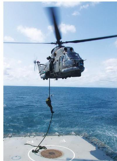
Grupă de luptători din cadrul grupului naval al forțelor pentru operații speciale în acțiune de boarding

Bineînțeles că primii pași îi îndreaptă pe doritorii de adrenalină către școala de scafandri unde își obțin brevetul de