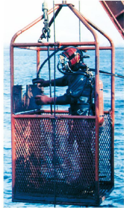
1985 - Lansarea la apă, de la bordul navei Emil Racoviță a capsulei de scufundare, în vederea realizării lucrărilor la platforma Gloria