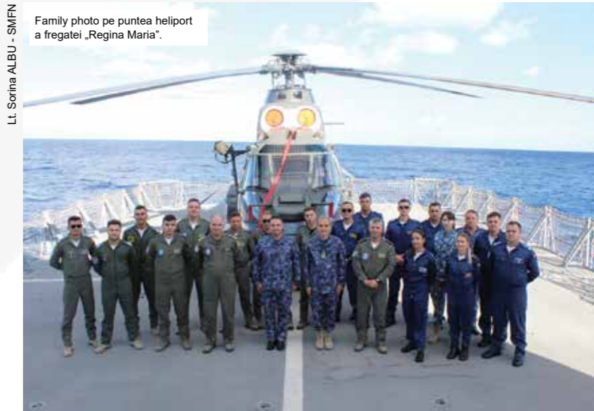
Family photo pe puntea heliport a fregatei „Regina Maria”.