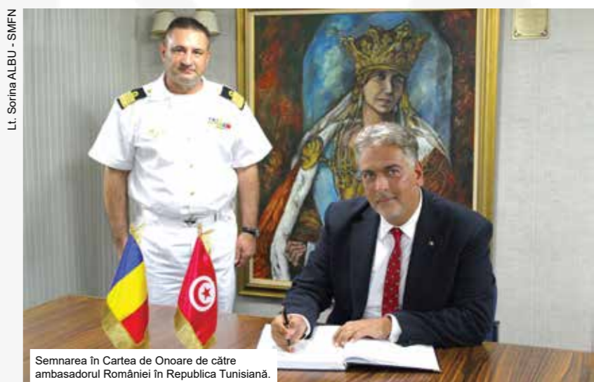
Semnarea în Cartea de Onoare de către ambasadorul României în Republica Tunisiană.