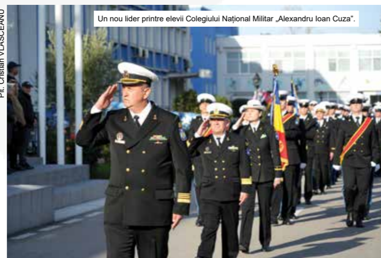
Un nou lider printre elevii Colegiului Național Militar „Alexandru Ioan Cuza”.

Iată că, schimbarea comenzii reprezintă un moment firesc în evoluția unităților militare, care evidențiază continuitatea, stabilitatea și asumarea responsabilă a misiunilor. Prin această tranziție, sunt consolidate standardele profesionale și angajamentul ferm pentru îndeplinirea obiectivelor la cel mai înalt nivel. (Cpt. Dora CERNAT-SIMION)