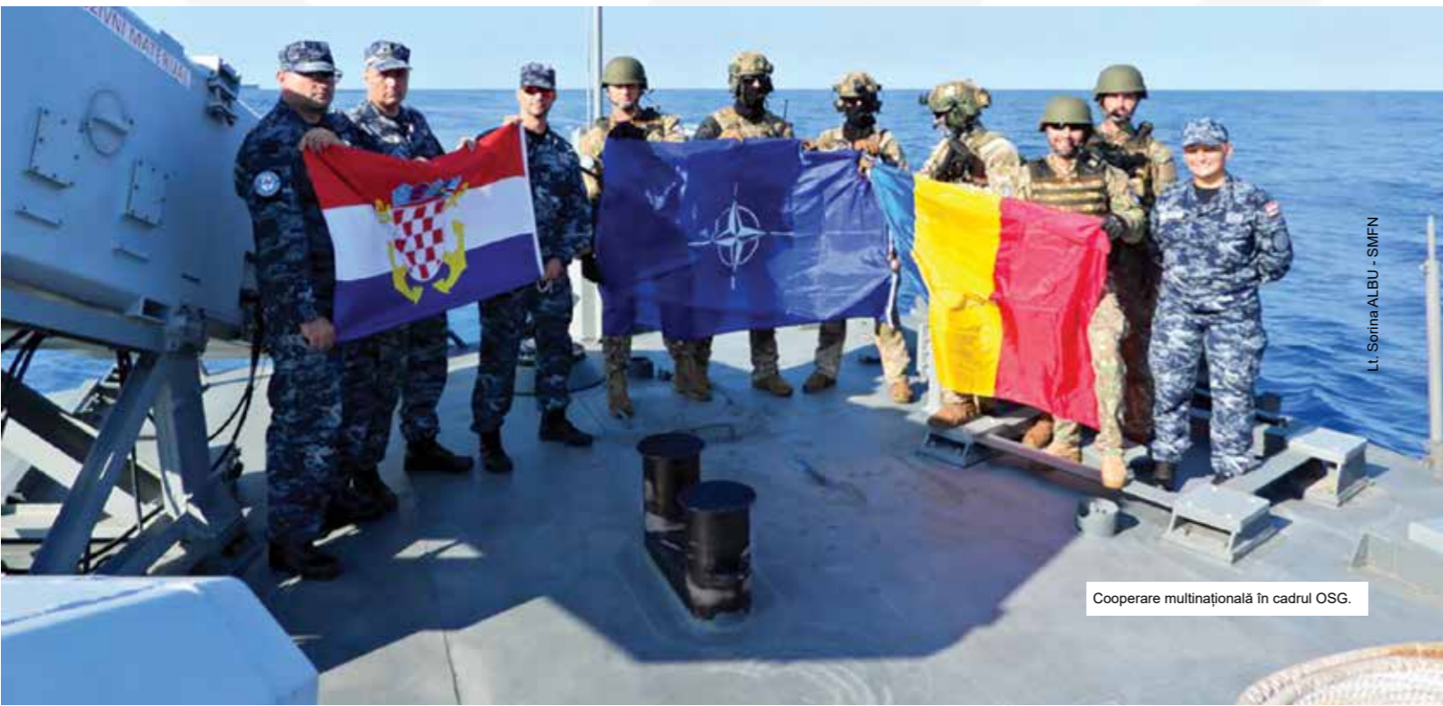
Cooperare multinațională în cadrul OSG.

Participarea Forțelor Navale Române la Operația NATO SEA GUARDIAN cu fregata „Regina Maria”, aflată sub comanda operațională a Comandamentului Forțelor Întrunite „General Ioan Emanoil Florescu”, a adus o contribuție semnificativă la asigurarea securității maritime în Marea Mediterană și la respectarea angajamentelor țării noastre față de comunitatea internațională și Alianța Nord-Atlantică. (Locotenent Sorina ALBU, Statul Major al Forțelor Navale)