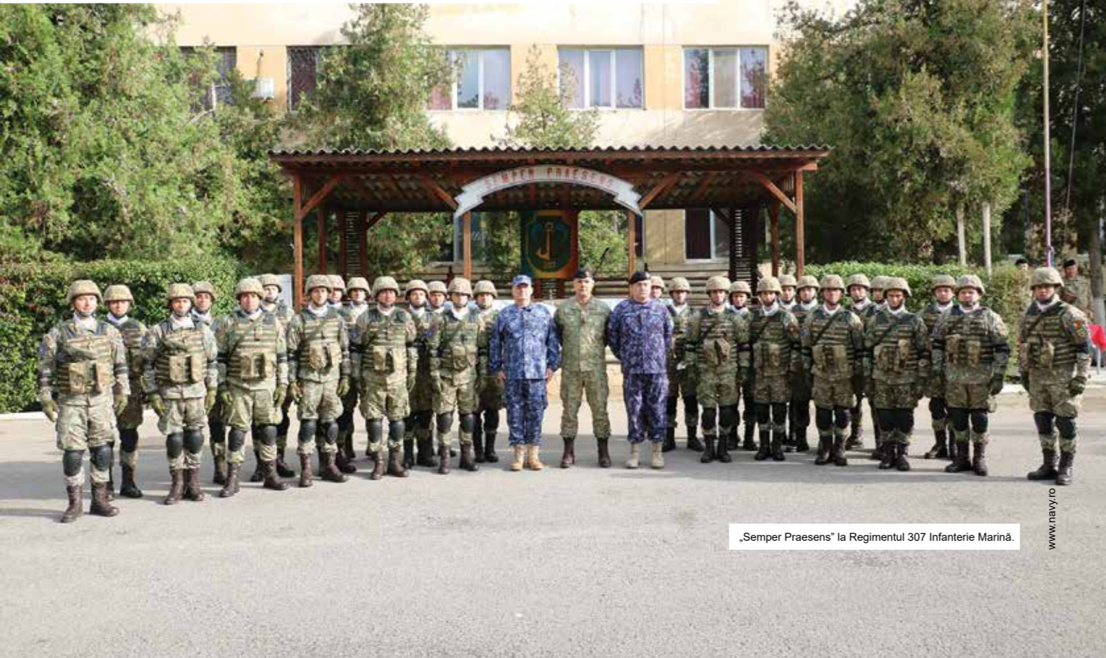
„Semper Praesens” la Regimentul 307 Infanterie Marină.