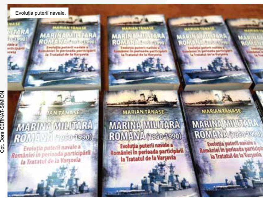
Evoluţia puterii navale.