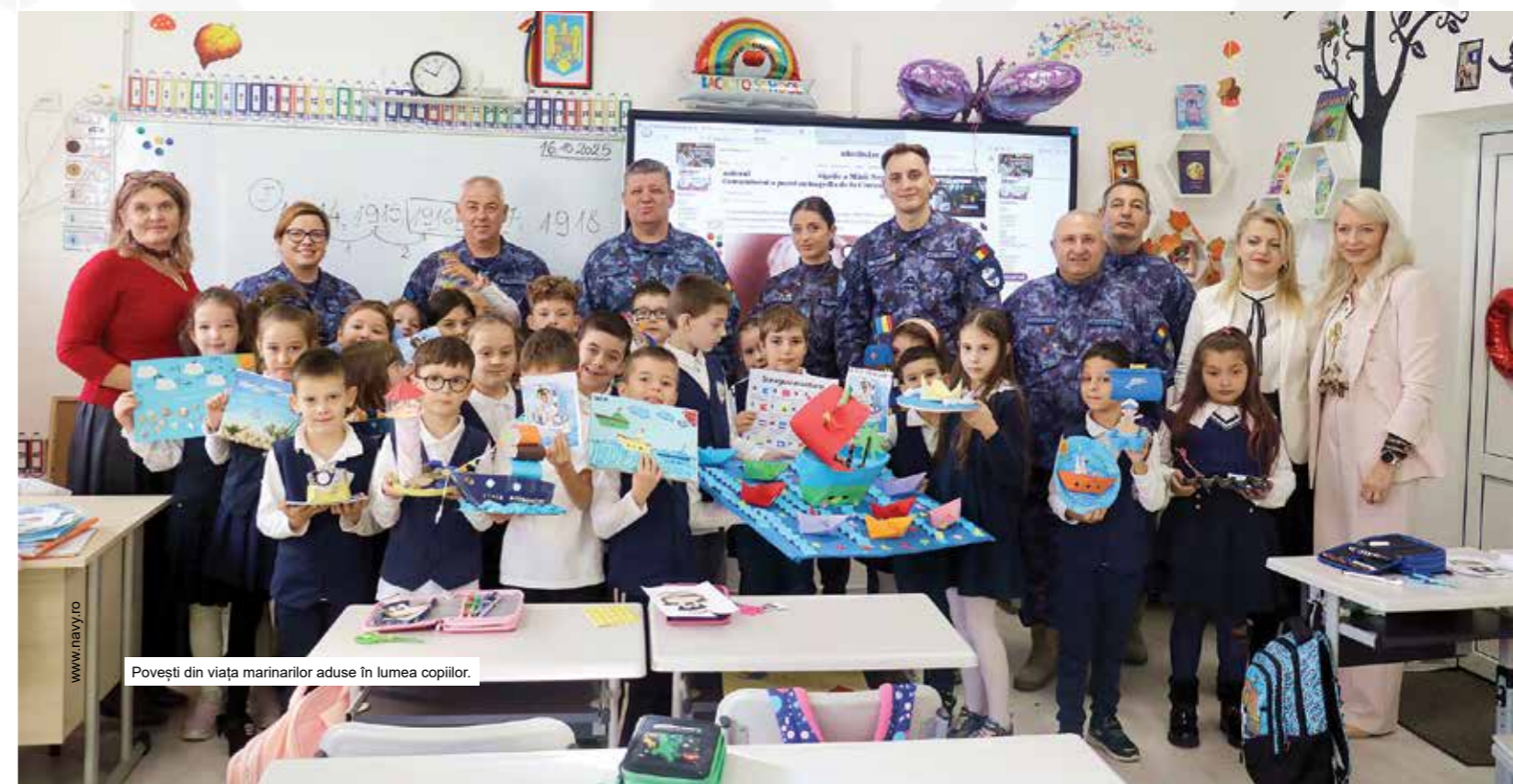
Povești din viața marinărilor aduse în lumea copiilor.