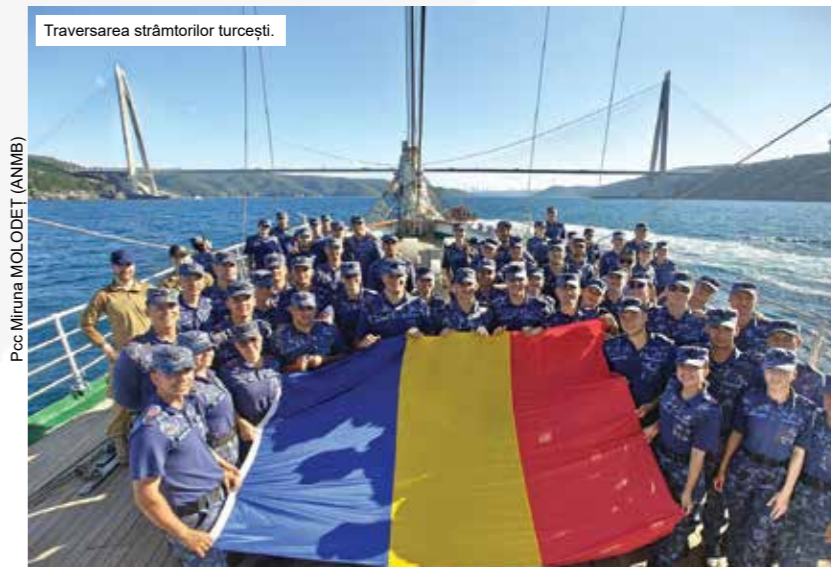
Traversarea strămtorilor turcești.