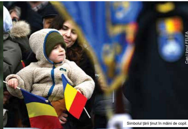
Simbolul țării ținut în mâini de copil.

Pe 1 decembrie, militarii Flotei Fluviale au participat, alături de colegii din garnizoanele Brăila, Tulcea și Babadag, la ceremoniile militar-religioase organizate cu prilejul sărbătorii Zilei Naționale a României. În cadrul ceremoniilor a fost intonat Imnul Național al României și au