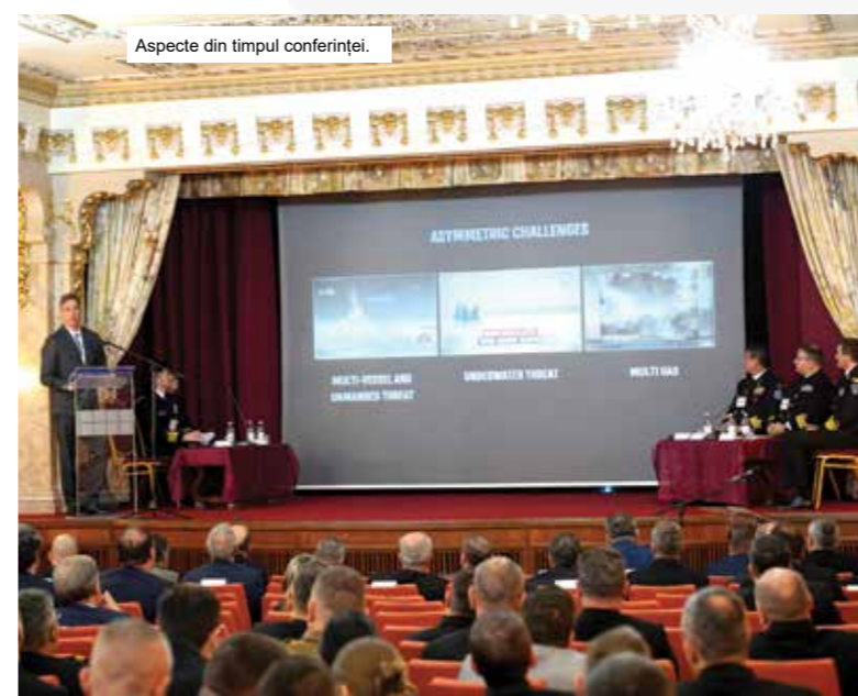
Aspecte din timpul conferinţei.

Un loc important în discuţii l-au ocupat măsurile de protecţie a infrastructurii critice şi dezvoltarea parteneriatelor cu producătorii de echipamente autonome.