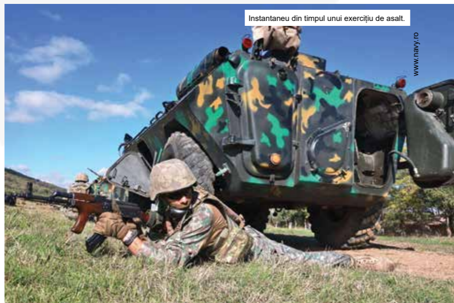
Instantaneu din timpul unui exercițiu de asalt.