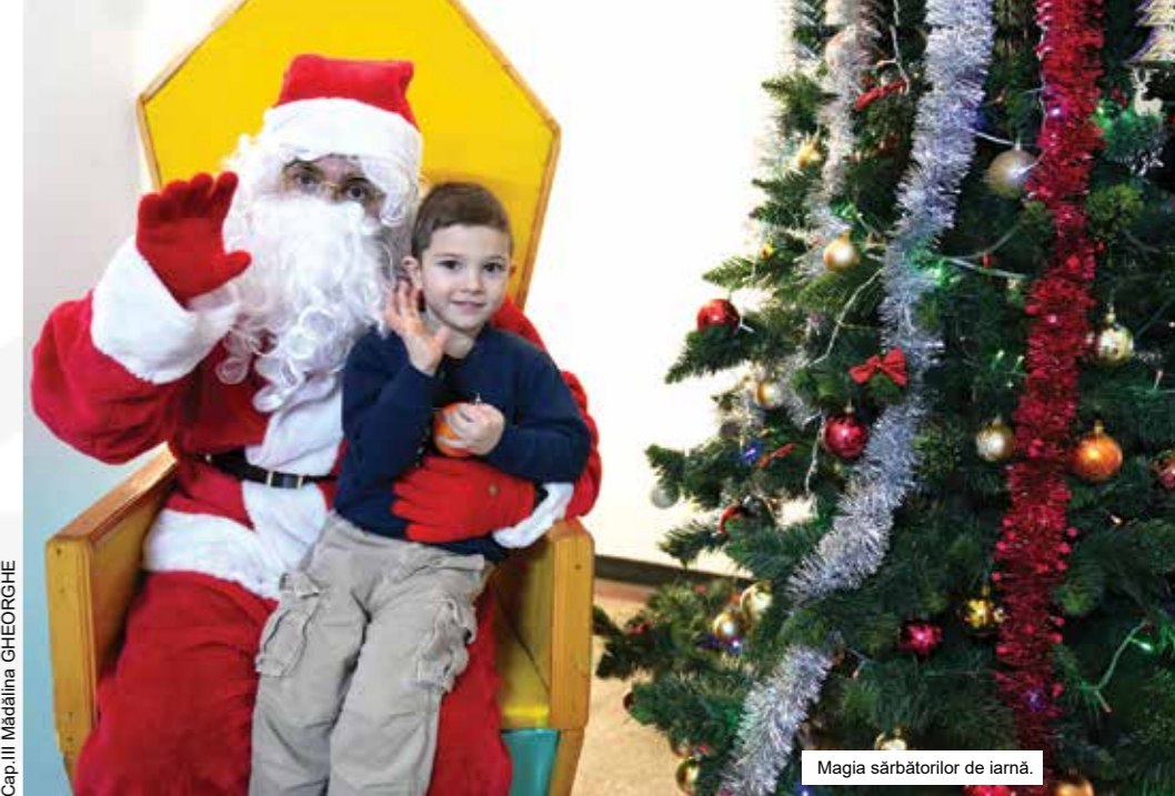
Magia sărbătorilor de iarnă.

Portul militar Constanța a fost animat, pe 19 decembrie, de bucuria sărbătorilor de iarnă, atunci când Moș