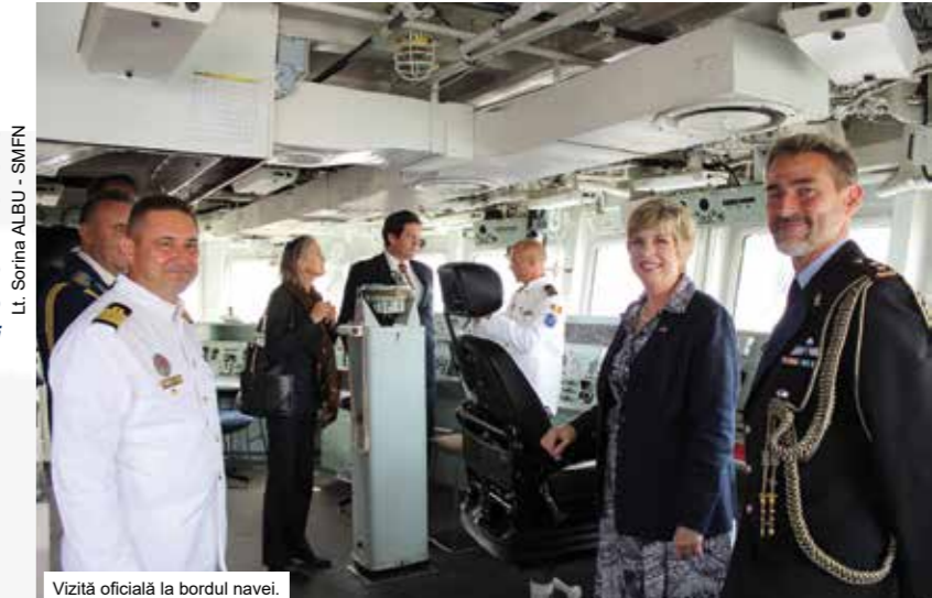
Vizită oficială la bordul navei.