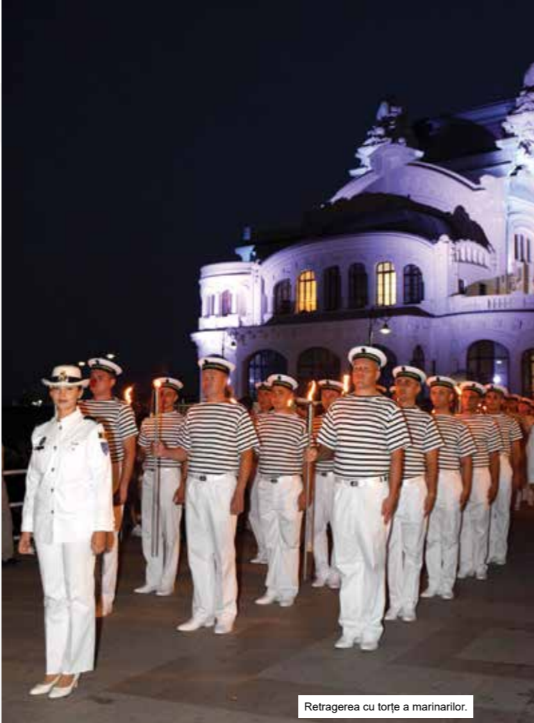
Retragerea cu torțe a marinarilor.

Timp de patru zile, vizitatorii au putut participa la atelierul interactiv de noduri marinărești și la prezentări despre cariera militară în Forțele Navale Române, activități organizate de Flotila Fluvială, în colaborare cu Biblioteca Județeană Galați V.A.Urechia. De asemenea, au descoperit tradiții, au învățat abilități practice și s-au inspirat din poveștile marinarilor adevărați.