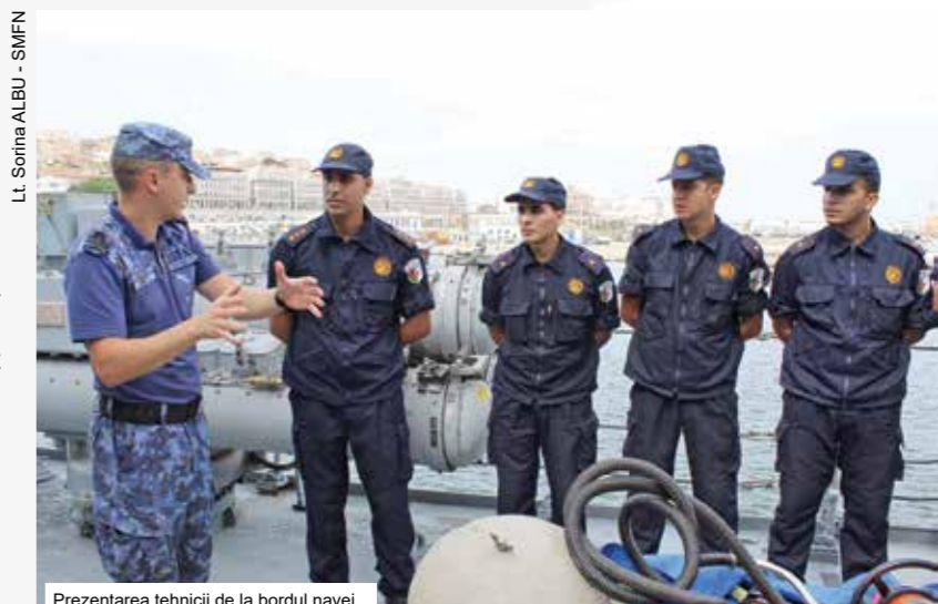
Prezentarea tehnicii de la bordul navei.