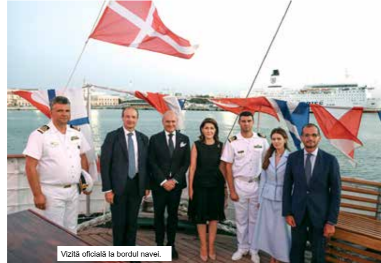
Vizită oficială la bordul navei.