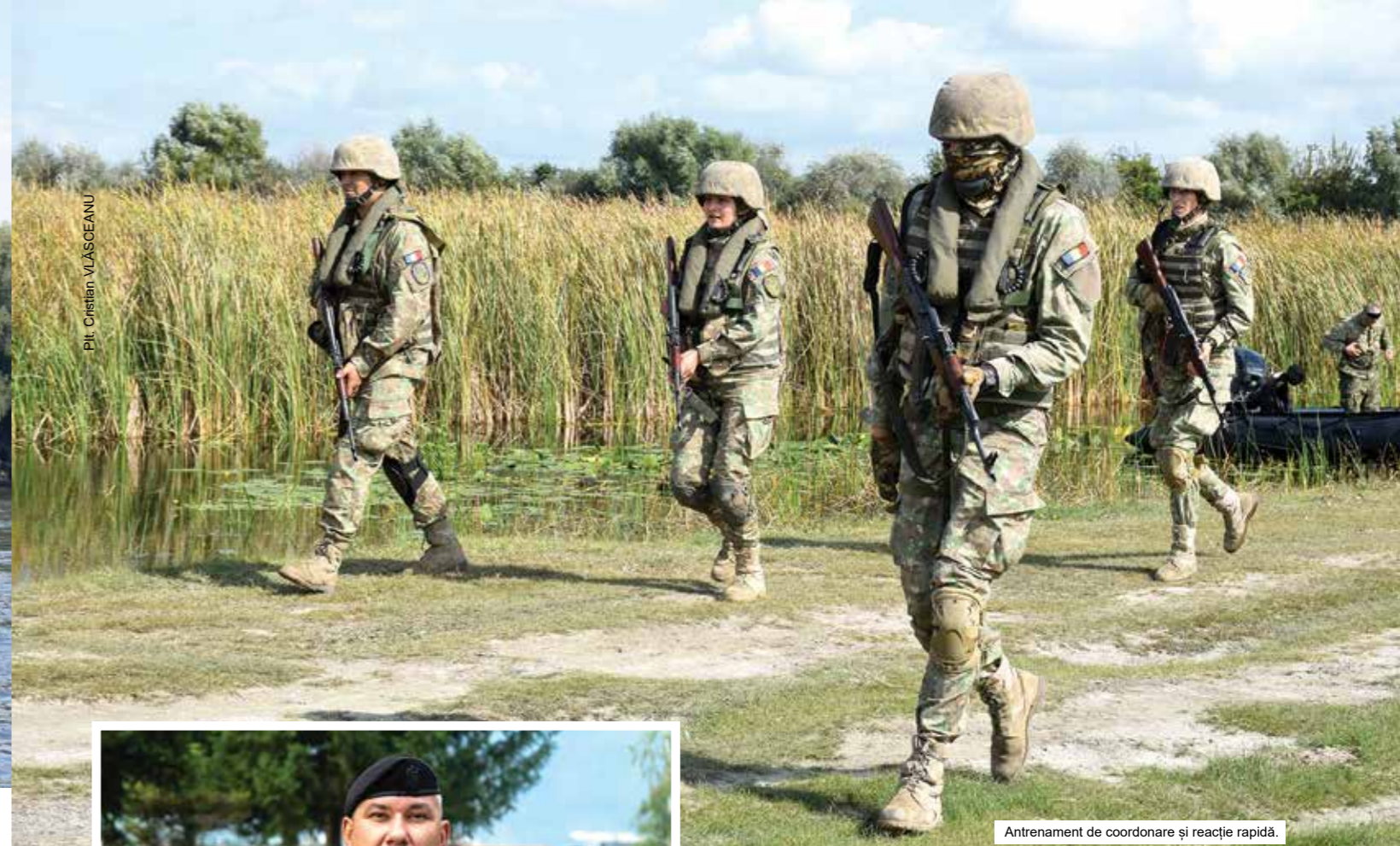
Antrenament de coordonare și reacție rapidă.

Deși oboseala se acumula cu fiecare zi care trecea, am reușit să păstrăm o atmosferă plăcută bazată pe încredere,