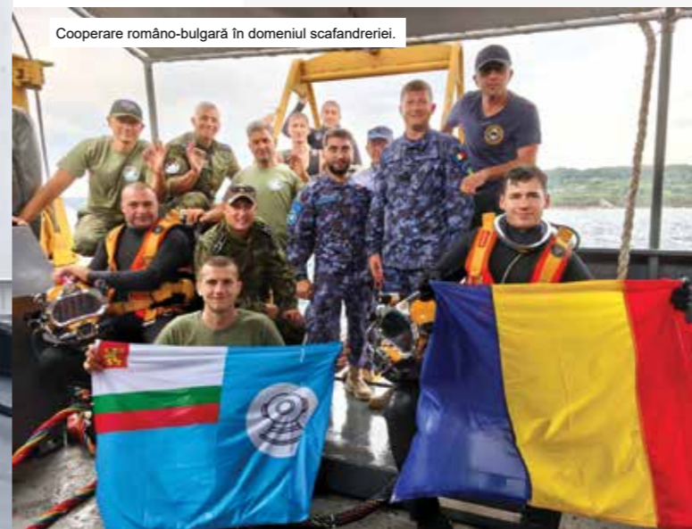
Cooperare româno-bulgară în domeniul scafandriei.