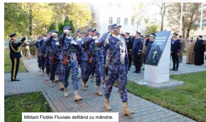
Militarii Flotei Fluviale defilând cu mândrie.

Ziua Armatei Române rămâne, astfel, nu doar un moment comemorativ, ci și unul de reafirmare a angajamentului față de valorile naționale și față de parteneriatele internaționale. Prin profesionalismul și dedicarea militarilor săi, Armata României își consolidează rolul de garant al stabilității și siguranței. (Slt. Alexandra GHIOC)