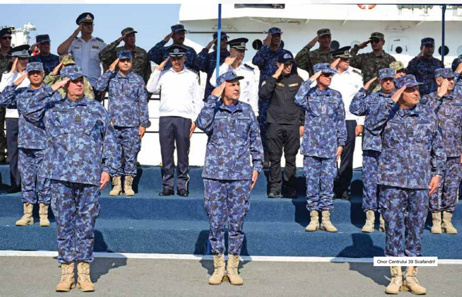
Onor Centrului 39 Scafandri!