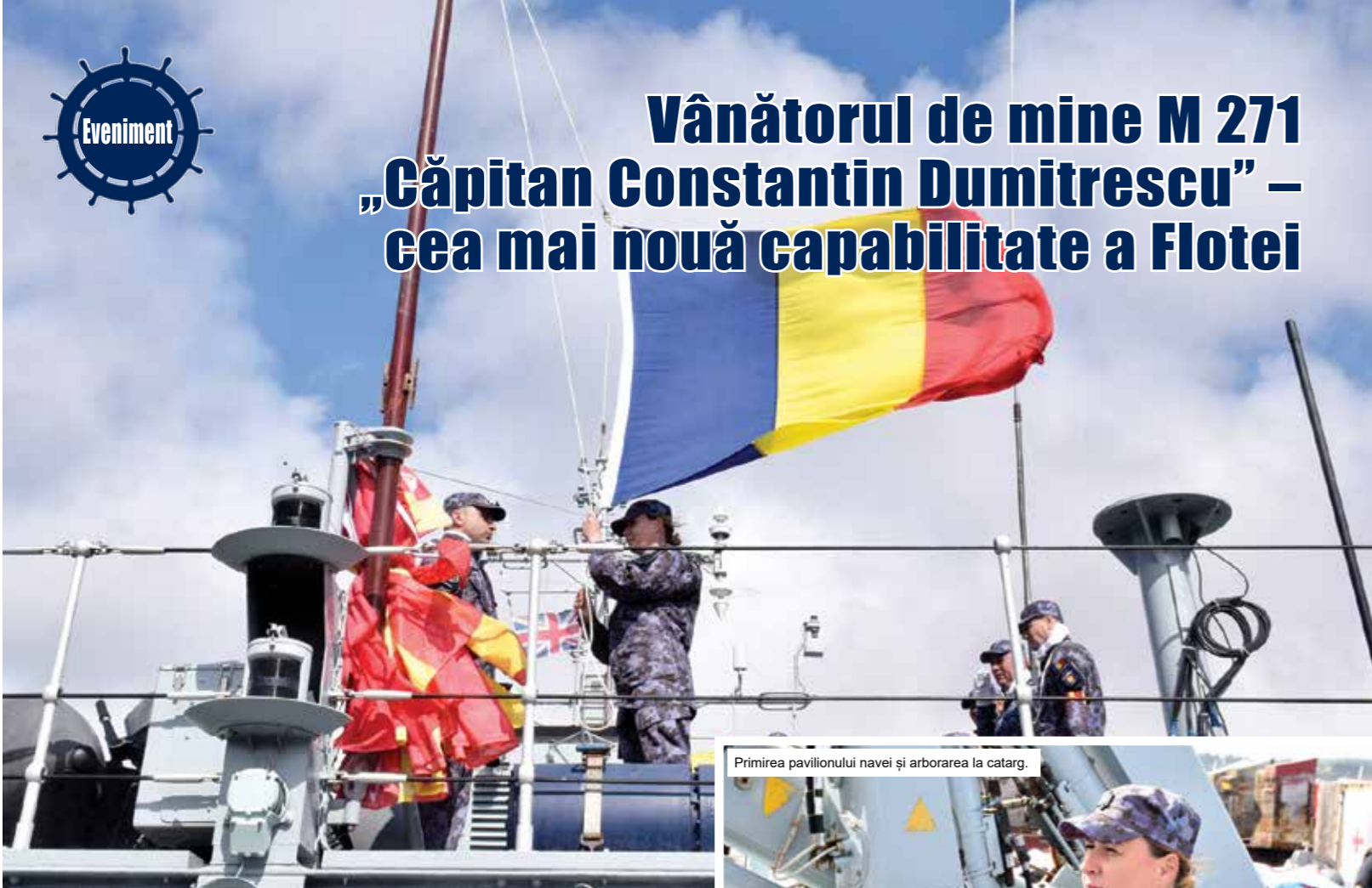
Primirea pavilionului navei și arborarea la catarg.