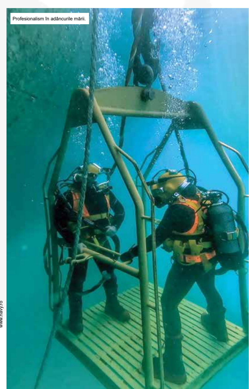
Profesionalism în adâncurile mării.