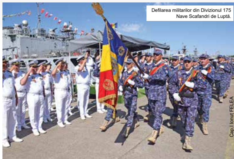
Defilarea militarilor din Divizionul 175 Nave Scafandri de Luptă.

Divizionul 175 Nave Scafandri de Luptă rămâne un simbol al profesionalismului și al devotamentului față de misiune, continuând să își pregătească militarii pentru provocările prezentului și ale viitorului, pe apă, sub apă și în aer. (Lt. Amalia BOBOC, Centrul 39 Scafandri)