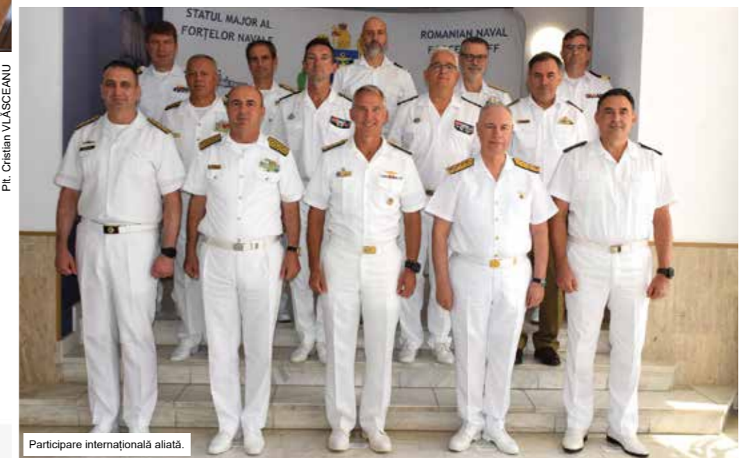
Participare internațională aliată.

Task Group), care, la acel moment, se afla sub comanda Forțelor Navale Române.