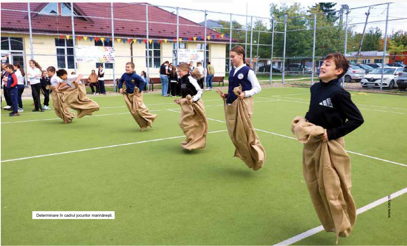
Determinare în cadrul jocurilor marinărești.

Privind spre viitor, fregata „Mărășești” își continuă misiunea sub același pavilion, purtând mai departe onoarea și responsabilitatea unei istorii construite cu disciplină, curaj și spirit de echipaj. (Slt. Alexandra GHIOC)