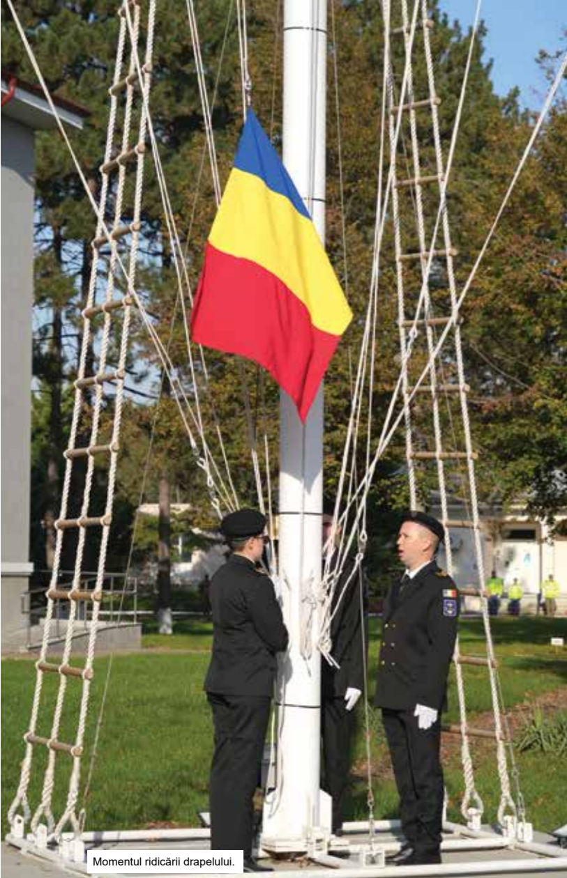
Momentul ridicării drapelului.