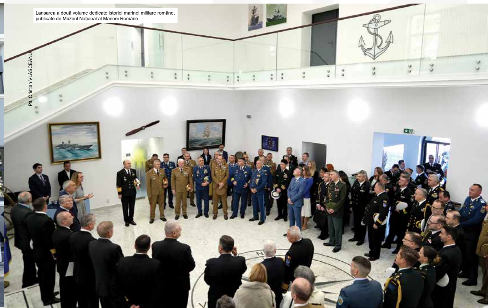
Lansarea a două volume dedicate istoriei marinei militare române, publicate de Muzeul Național al Marinei Române.