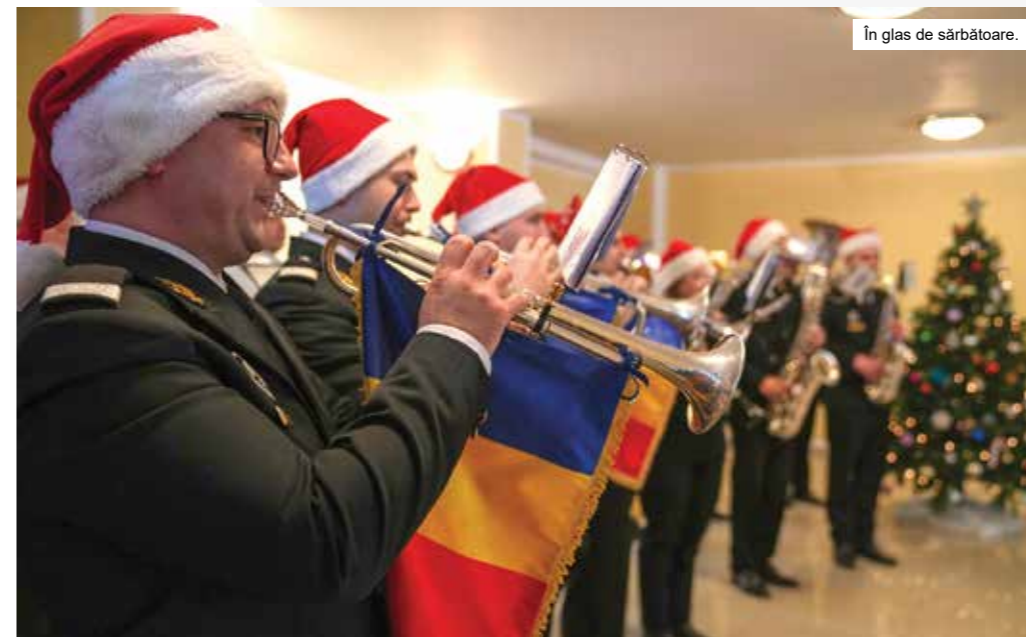
În glas de sărbătoare.

La finalul activității, corurile formate din studenți ai Academiei Navale „Mircea cel Bătrân” și elevi ai Școlii Militare de Maiștri Militari a Forțelor Navale „Amiral Ion Murgescu” au adus spiritul sărbătorilor de iarnă în Sala de Conferințe a Forțelor Navale, printr-un concert de colinde tradiționale românești. Momentul artistic, întregit de Muzica Militară a Forțelor Navale, a oferit participanților un moment de liniște și reflecție, specific acelei perioade a anului. (Lt.cdor Marina TOPOR – Flotila Fluvială, Cpt. Dora CERNAT)