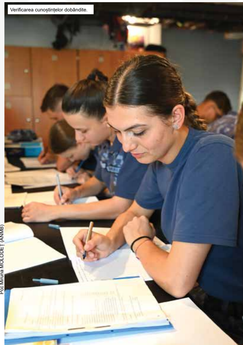
Verificarea cunoștințelor dobândite.