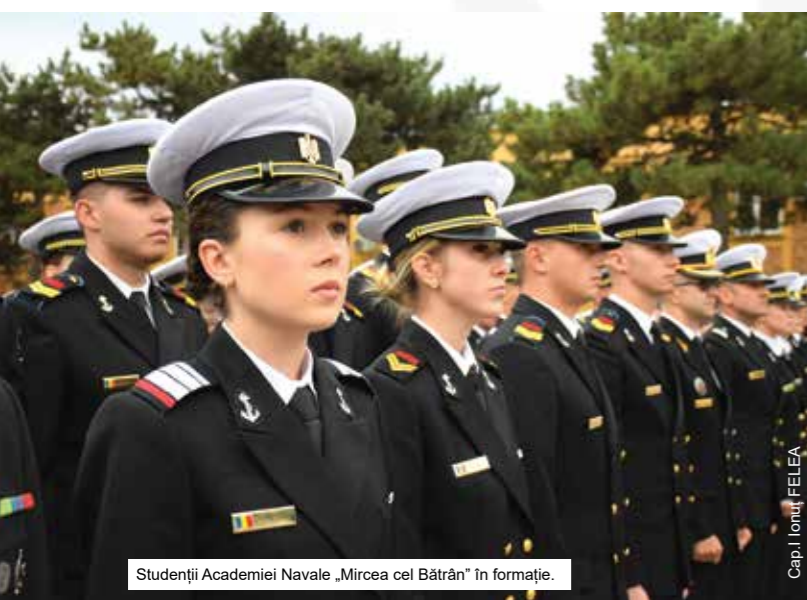
Studenții Academiei Navale „Mircea cel Bătrân” în formație.

Totodată, evenimentul a reprezentat o oportunitate de reafirmare a angajamentului Academiei Navale de a-și adapta constant programele de studii la cerințele actuale ale mediului operațional, în concordanță cu standardele NATO și cu evoluțiile tehnologice din domeniul maritim. Viața de student militar în cadrul Academiei Navale „Mircea cel Bătrân” presupune un echilibru constant între rigoarea pregătirii academice și disciplina specifică mediului militar. Programul zilnic este bine structurat, îmbinând cursurile teoretice și aplicațiile practice cu activități de instruire militară, exerciții fizice și formarea deprinderilor de leadership. Dincolo de provocările inerente, studenții își dezvoltă un puternic spirit de camaraderie, învață să lucreze în echipă și să își asume responsabilități încă din primii ani de formare. Viața în acest mediu contribuie nu doar la acumularea de cunoștințe, ci și la formarea caracterului, cultivând valori precum disciplina, respectul, onoarea și devotamentul față de țară. (Slt. Alexandra GHIOC)