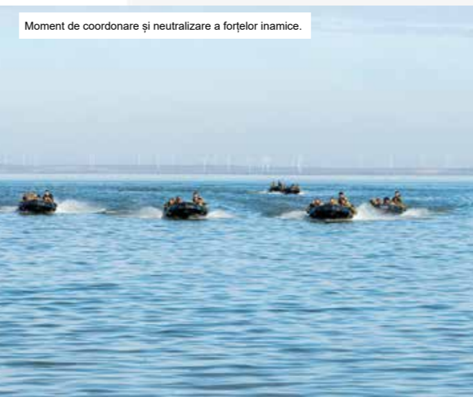
Moment de coordonare și neutralizare a forțelor inamice.