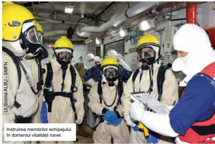
Instruirea membrilor echipajului în domeniul vitalității navei.

F-222 a intrat, pe data de 8 octombrie, în portul Souda, din Insula Creta, pentru refacerea capacității de luptă și pentru a încheia participarea la Operația NATO SEA GUARDIAN