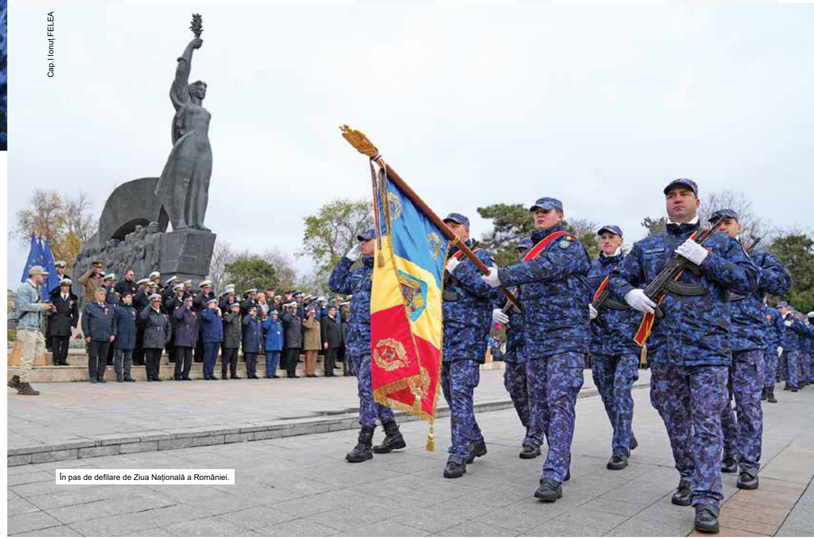
În pas de defilare de Ziua Națională a României.

drepti, au dat greutate fiecărui acord, într-o demonstrație de respect, disciplină și devotament pentru țară. Iar în jur, publicul a cântat cu sufletul, alăturându-se interpretei într-un glas, transformând imnul într-o vibrație comună, într-un moment de unitate și mândrie românească.