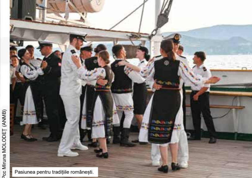
Pasiunea pentru tradițiile românești.

Când vine vorba despre studenții de la specializarea Inginerie și Management Naval și Portuar, din cadrul Facultății de Navigație și Management Naval, aceștia au ajutat la recepția alimentelor și a consumabilelor necesare, în portul Varna. Au făcut controlul cantitativ și calitativ, cu ajutorul sanitarilor de la bordul navei și a ofițerilor de logistică. Viitorii ofițeri de logistică au participat, în toate porturile, la procesul de refacere a plinurilor navei și la întâlnirile cu agenții care au reprezentat legătura dintre navă și distribuitorii de alimente, combustibil și alte produse necesare zilelor de marș.