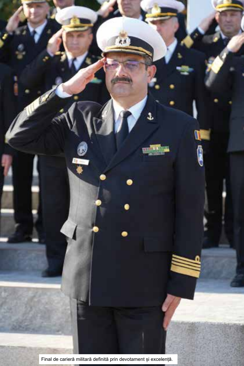
Final de carieră militară definită prin devotament și excelență.