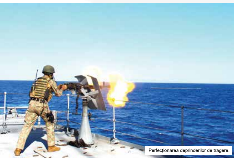
Perfecționarea deprinderilor de tragere.