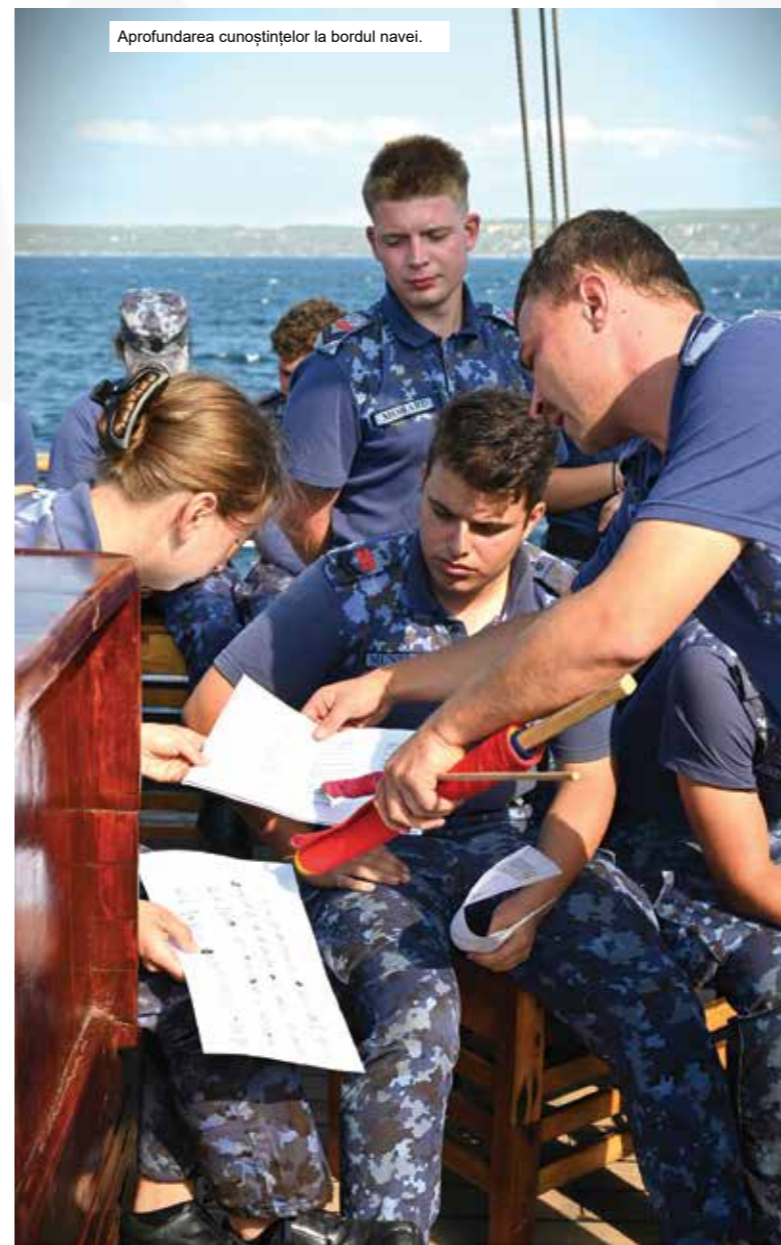
Aprofundarea cunoștințelor la bordul navei.

Fiecare zi la bordul lui „Mircea” reprezintă o provocare, astfel că studenții au fost „surprinși” de un incendiu în cazarma lor, acesta dovedindu-se a fi, însă, doar o simulare. În activitate au fost implicați militarii din grupa de vitalitate a navei, din care face parte și echipa medicală care a făcut o serie de demonstrații de acordare a primului ajutor.