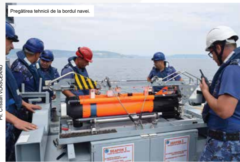
Pregătirea tehnicii de la bordul navei.