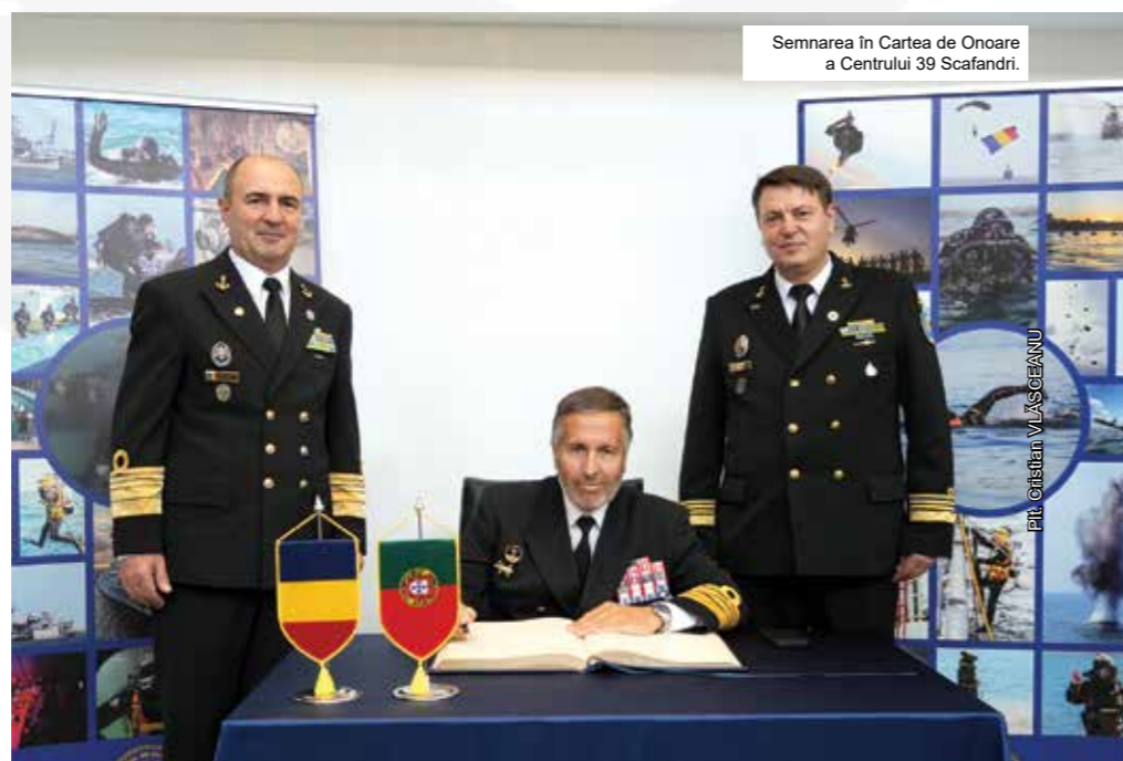
Semnarea în Cartea de Onoare a Centrului 39 Scafandri.

Vă doresc mulți ani înainte, în spiritul acestei tradiții glorioase!