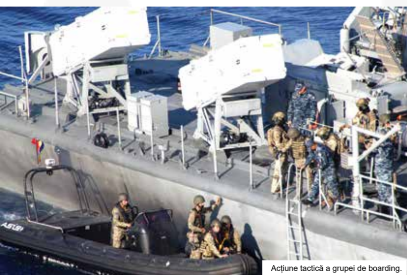
Acțiune tactică a grupeii de boarding.