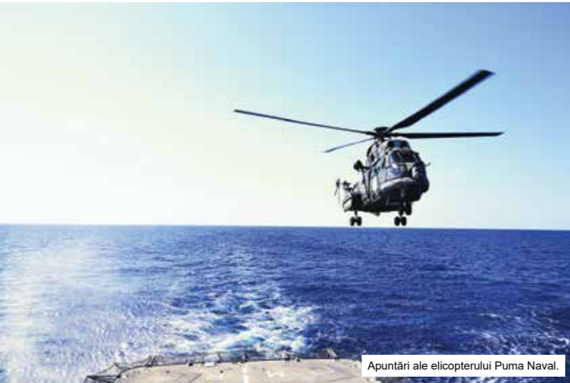
Apunări ale elicopterului Puma Naval.