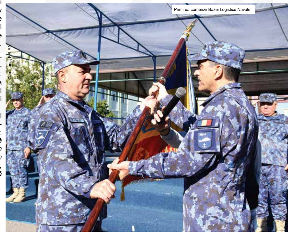
Primirea comenzii Bazei Logistice Navale.