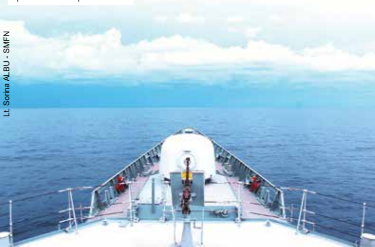
Lt. Sorina ALBU - SMFN