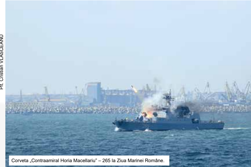
Corveta „Contraamiral Horia Macellariu” – 265 la Ziua Marinei Române.

Competiția a constat în întrecerea militarilor la cinci probe: tras la rame, pară, confectionarea de noduri marinărești, aruncarea grenadelor de mână și crossfit. La