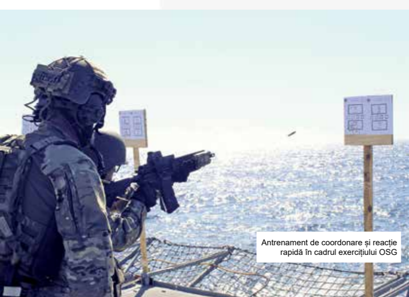
Antrenament de coordonare și reacție rapidă în cadrul exercițiului OSG