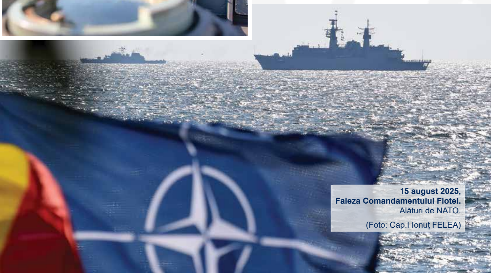
15 august 2025, Faleza Comandamentului Flotei. Alături de NATO.