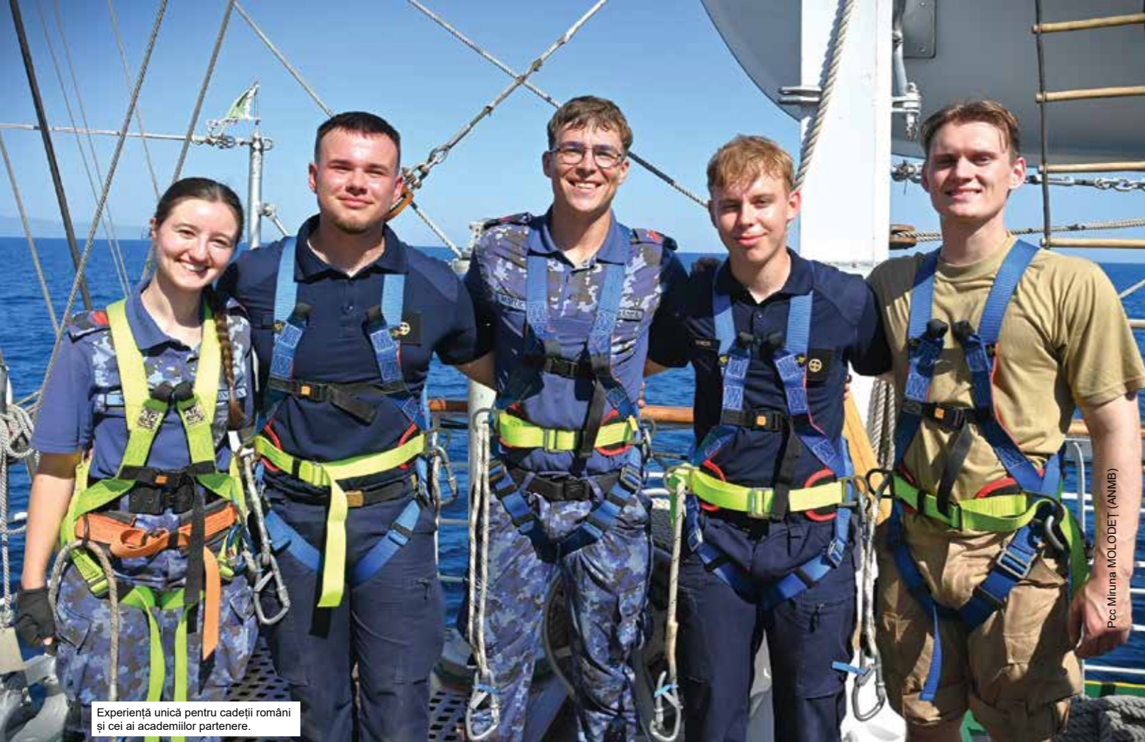
Experiență unică pentru cadeții români și cei ai academiilor partenere.