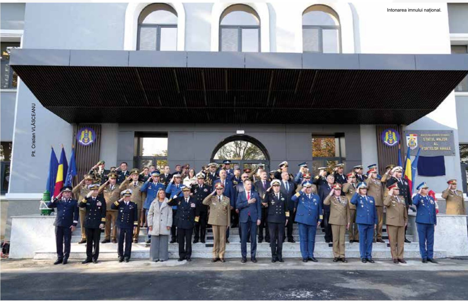
Intonarea imnului național.

Programul delegației portugheze a inclus participarea la conferința „Noi concepte, tehnologii și echipamente”,