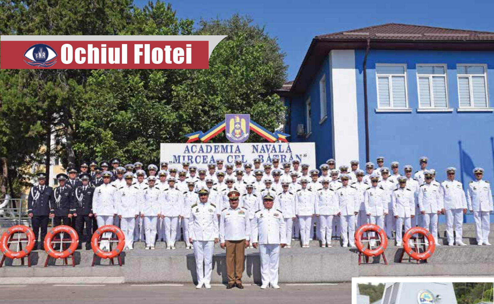
ACADEMIA NAVALĂ „MIRCEA CEL BĂTRÂN”