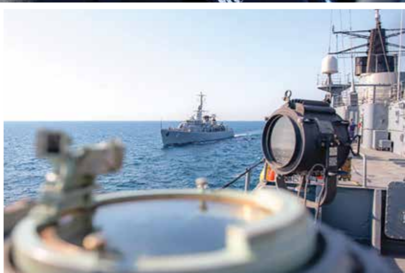
◀ 14 iulie 2025, Marea Neagră. Aspecte din timpul Exercițiului Multinațional BREEZE 25.