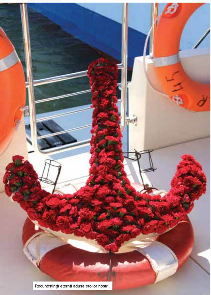
Recunoștință eternă adusă eroilor noștri.

Marinarii și scafandrii fluviali, aflați la bordul navelor militare și în ambarcațiunile rapide, și-au sincronizat acțiunile tactice, pentru a demonstra potențialul combativ al Flotei Fluviale, transmitând astfel un semnal de încredere populației civile din orașele dunărene, precum și din localitățile Deltei Dunării. Nu au lipsit din program sosirea Zeului Neptun, botezul marinăresc, și nici jocurile marinărești desfășurate pe apă. Festivitățile prilejuite de Ziua Marinei s-au încheiat cu mult-așteptata retragere cu torțe a militarilor Flotei Fluviale, însoțită de Muzica Militară a Garnizoanei Brăila.