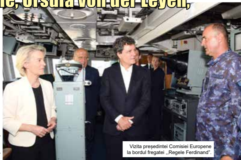
Vizita președintei Comisiei Europene la bordul fregatei „Regele Ferdinand”.

Vizita s-a desfășurat în cadrul unui turneu european în statele aflate în proximitatea conflictului din Ucraina, având