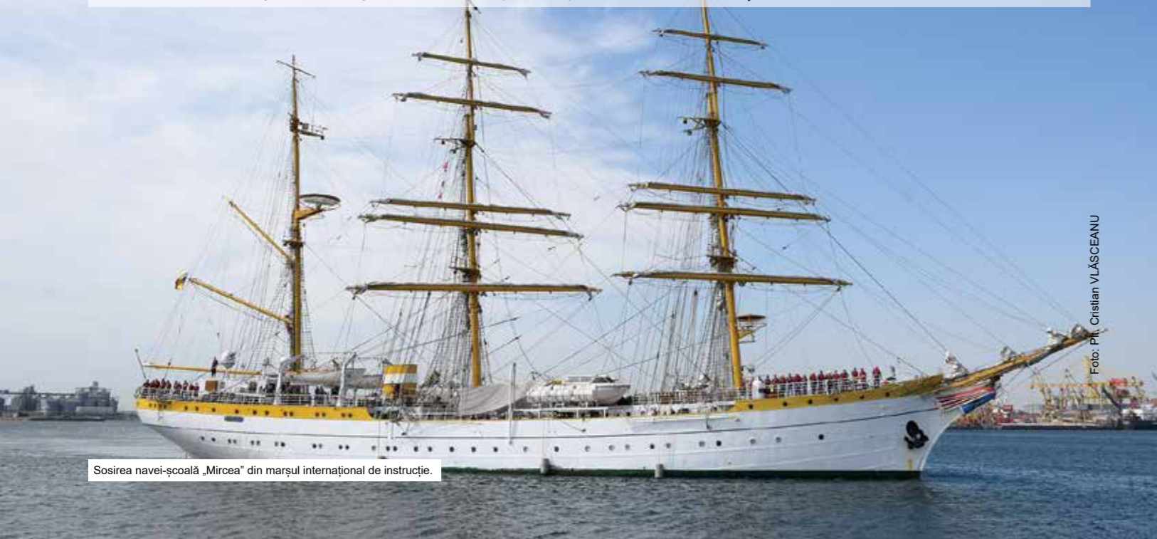
Sosirea navei-școală „Mircea” din marșul internațional de instrucție.

La bordul velierului „ambasador al României sustenabile” au fost, pe timpul marșului, 89 de studenți români și străini, care au învățat să lucreze în echipă și să facă față, fără emoții, tuturor provocărilor. Ei au fost pregătiți de instructorii de la Academia Navală „Mircea cel Bătrân”, dar și de membri ai echipajului navei care, încă de la ambarcare, i-au primit cu brațele deschise. (Miruna MOLODEȚ, Academia Navală „Mircea cel Bătrân”)