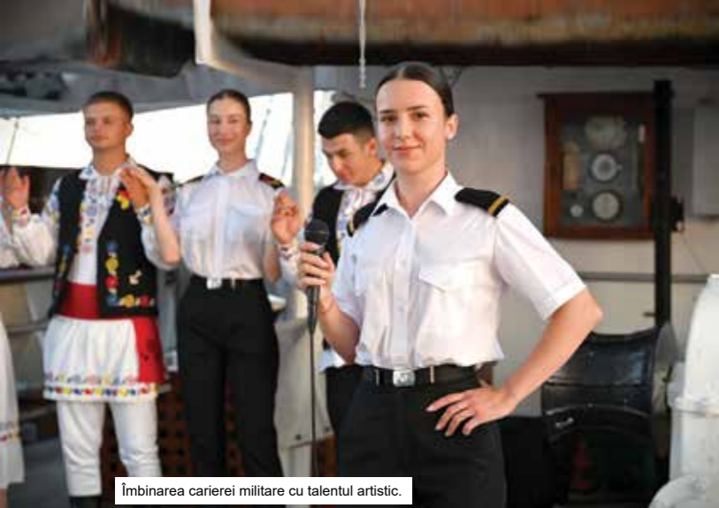
Îmbinarea carierei militare cu talentul artistic.