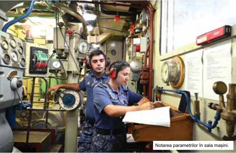
Notarea parametrilor în sala mașini.