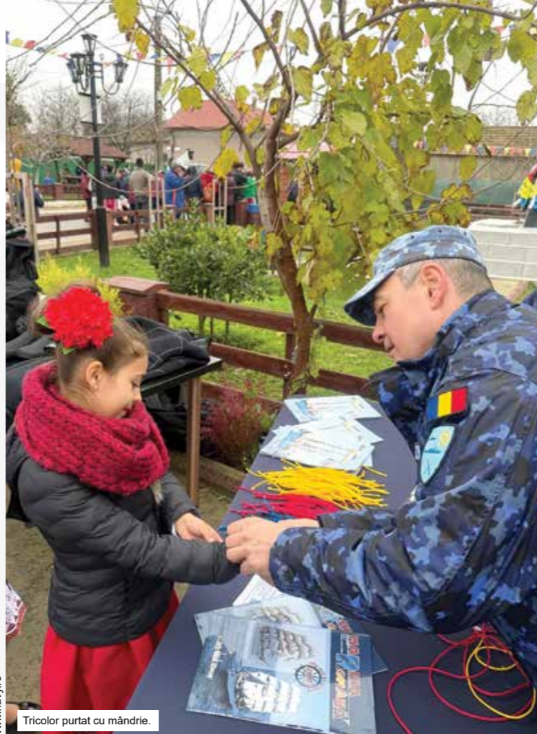
Tricolor purtat cu mândrie.

Militarii Regimentului 307 Infanterie Marină au salutat întreaga țară în ziua de 1 Decembrie, purtând cu mândrie tradițiile infanteriei marine și simbolurile naționale. Participarea lor la paradă este nu doar o demonstrație de disciplină și profesionalism, ci și un omagiu adus celor care au servit România de-a lungul timpului.