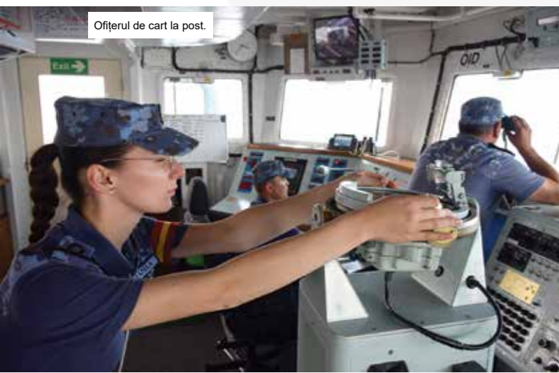
Ofițerul de cart la post.

Prin activitățile desfășurate, Grupul operativ pentru combaterea minelor marine din Marea Neagră a contribuit în mod constant la creșterea securității maritime regionale, la prevenirea riscurilor pentru traficul naval și la întărirea cooperării dintre forțele navale ale statelor participante, demonstrând angajamentul comun pentru stabilitatea și siguranța navigației în Marea Neagră. (Cpt. Dora CERNAT-SIMION)