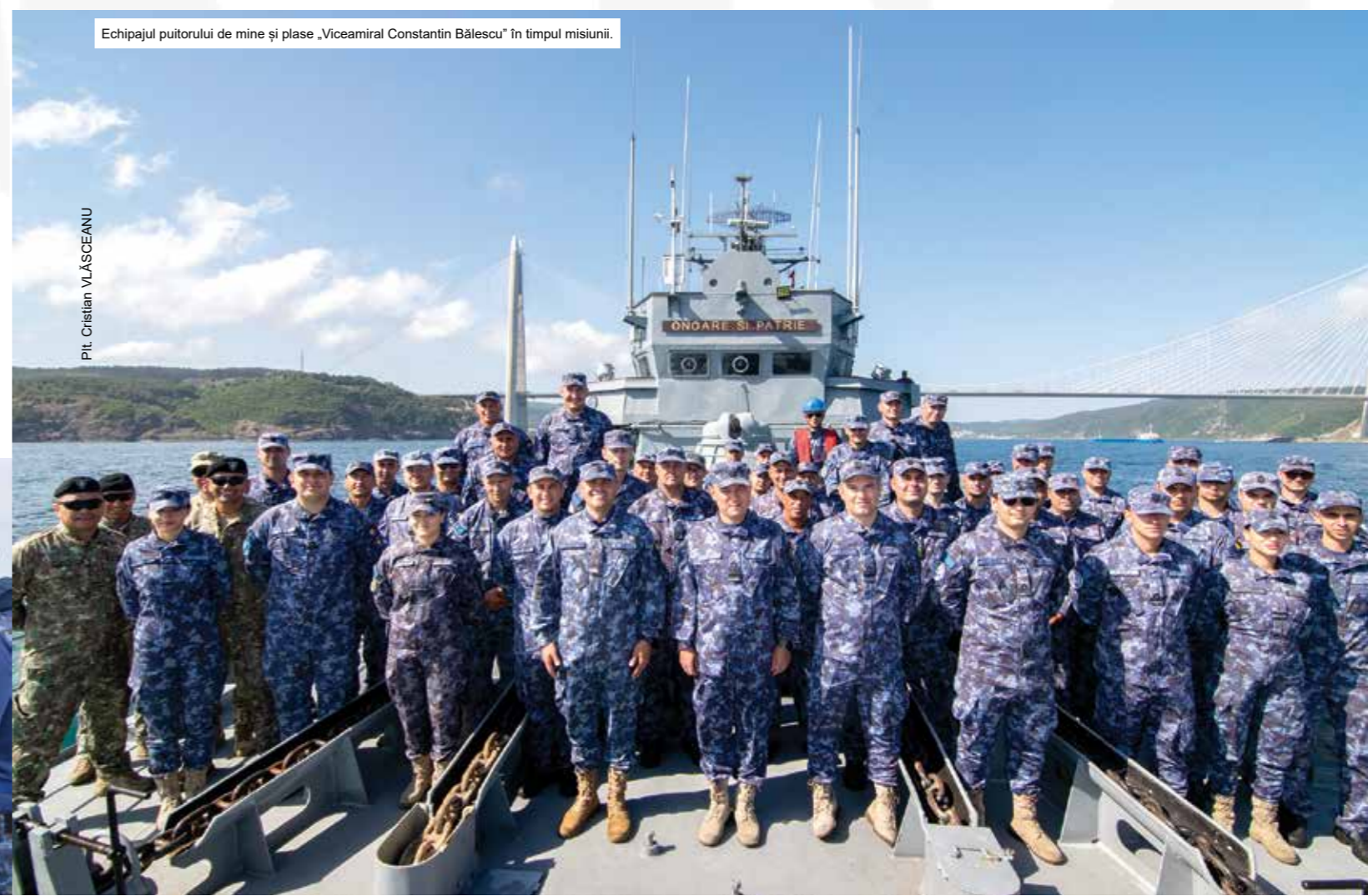
Echipajul puitorului de mine și plase „Viceamiral Constantin Bălescu” în timpul misiunii.