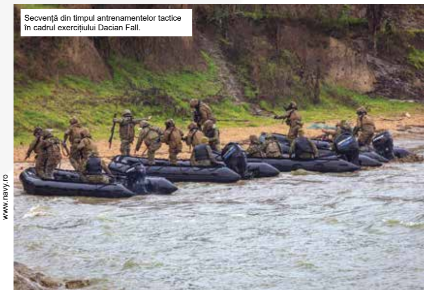
Secvență din timpul antrenamentelor tactice în cadrul exercițiului Dacian Fall.