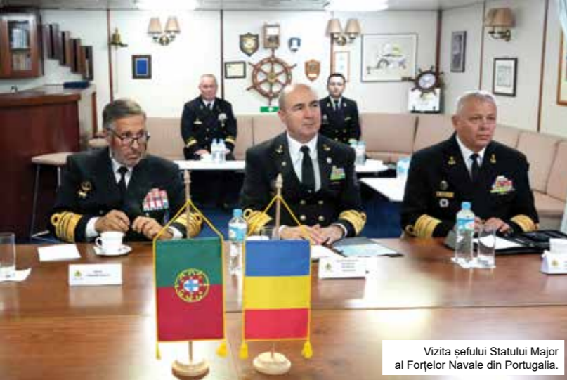
Vizita șefului Statului Major al Forțelor Navale din Portugalia.