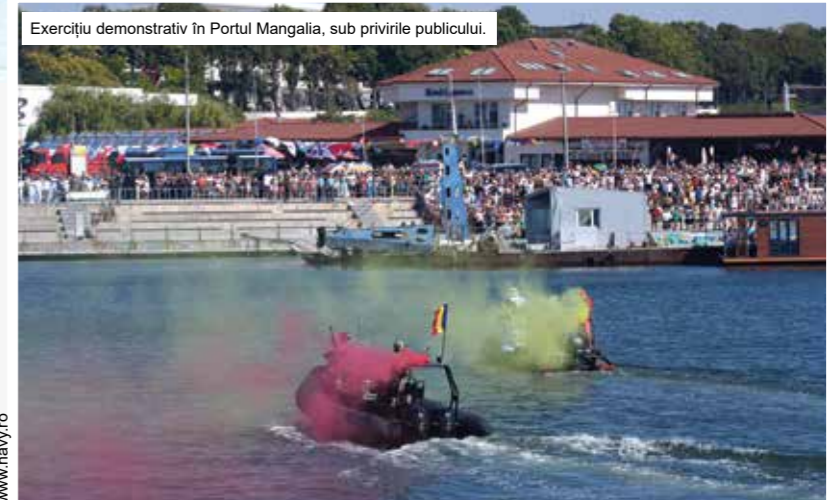
Exercițiu demonstrativ în Portul Mangalia, sub privirile publicului.